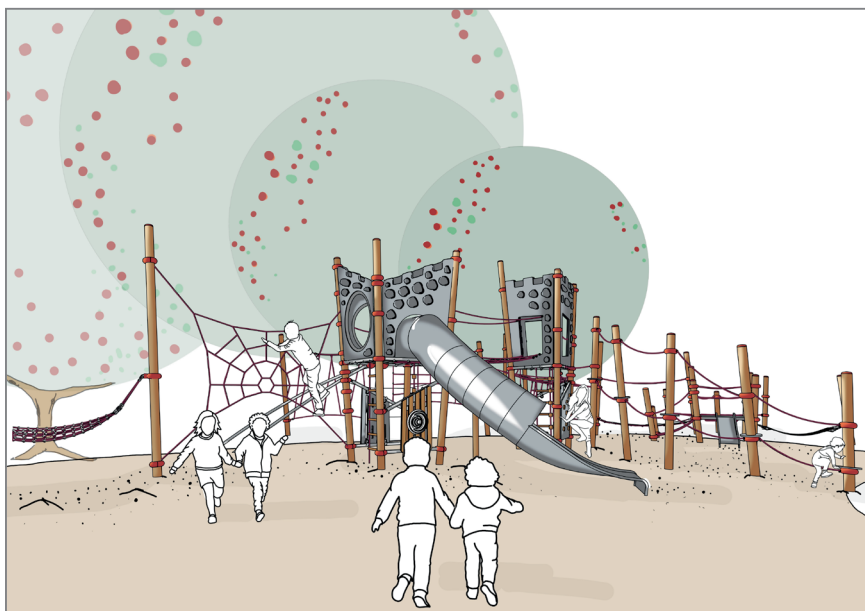
ENTWURF VARIANTE 2

Fragmente einer Burg „Ein Schloss in den Wolken“