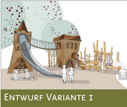
ENTWURF VARIANTE I

Die Stadt Bernau präsentiert drei Entwürfe für den neuen Spielplatz im Stadtpark, für Kinder von 0 bis 10 Jahren – vor Ort und online über die Website der Stadt. Bis 6. Januar 2026 kann per Umfrage abgestimmt werden, wie der Spielplatz aussehen soll. Jede Stimme zählt!