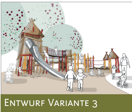
ENTWURF VARIANTE 3

Konzept: Graue Steinmauern erheben sich – doch darüber schweben Netzpodeste, Hängematten und schwebende Brücken wie aus einem Märchen. Klettern, balancieren, träumen: Hier ist alles möglich! Niedrige Einstiege, unterfahrbare Netze und Handlaufseile garantieren Sicherheit. Die Burg wirkt wie eine Ruine, ist aber ein offenes Abenteuer für alle.