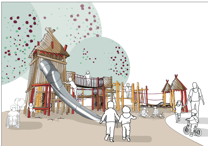
ENTWURF VARIANTE 3

Fragmente einer Burg „Ein Schloss in den Wolken“