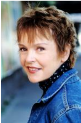
Katrin Sass Schauspielerin bekannt aus „Bis daß der Tod euch scheidet“, „Good Bye, Lenin!“, „Weissensee“